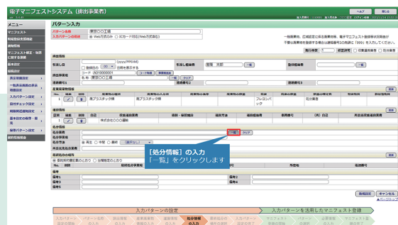
▲新規登録の一部抜粋

画面上に表示されるガイドに従って操作を体験できます。申込や事前準備をせずに手軽に操作を体験したい方向けのツールです。操作体験セミナーで実際に操作する内容を体験できます。